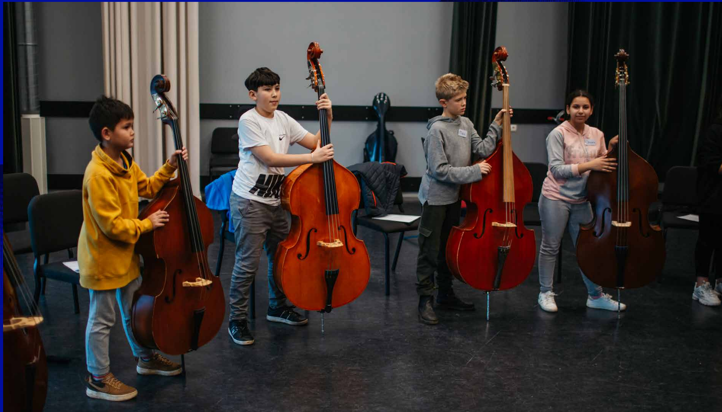
Workshop contrabas voor kinderen van IMC on Tour

aan. De geselecteerde studenten worden gedurende één van onze projecten opgenomen in het ensemble: zij nemen deel aan het volledige repetitieproces en gaan vervolgens als volwaardig orkestlid mee op tournee. In 2021 speelden vier masterstudenten mee met het programma De Slavische ziel met Anthony Marwood en Hannes Minnaar. Zij werden intensief begeleid door onze musici en leerden zo onze unieke ongedirigeerde speelbenadering in de praktijk toe te passen. De samenwerking met het CvA leidde al tot het aantrekken van nieuw jong toptalent binnen het ensemble.