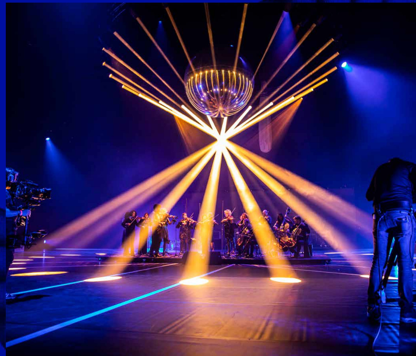
Opname van Wende's Kerstkaleidoscoop

De online editie van Sinfonietta String Festival Zeeland werd in juni uitgezonden via NPO 2 extra. In november kwam Rufus Wainwright speciaal voor een tv-optreden naar Amsterdam, ter promotie van het nieuwe album Rufus Wainwright and Amsterdam Sinfonietta Live en de nieuwe Breder dan klassiek-tour in januari 2022. Met een kleinere strijkersgroep en Wainwright aan de piano speelden we het nummer Argentina tijdens talkshow M op NPO 1. Op uitnodiging van Wende sloten we het jaar af met Wende's Kerstkaleidoscoop, dat op Eerste Kerstdag werd uitgezonden op NPO 2.